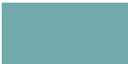
RAL 6034 Ar